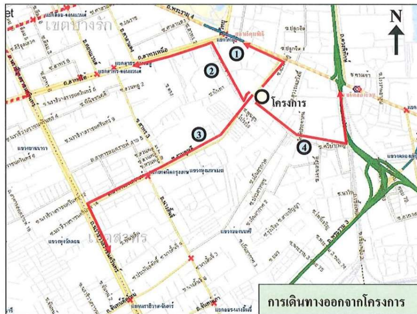
รูปที่ 2.1-2 ที่ตั้งโครงการโดยสังเขป และการเดินทางเข้า-ออกพื้นที่โครงการ